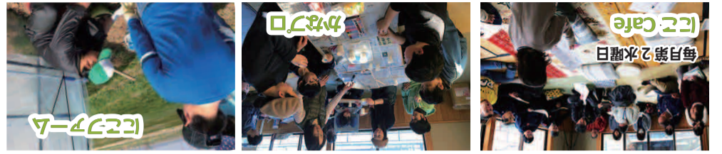
毎月第2水曜日 にこCafe

一般開放講座を毎月開催。発達障害についてワークを交えて楽しく学んでいます。 地域のプロの技を子どもたちに。中田町の農家さんから畑をお借りして、栽培活動(農業活動)を子どもたちと一緒にしています。