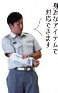
身近なアイテムで対応できます