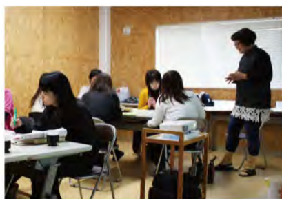
話す人の持ち時間は平等 二人の大演説はみんなの大迷惑だよ