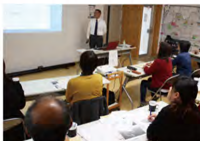
税金は、社会を支える会費のようなものだよ